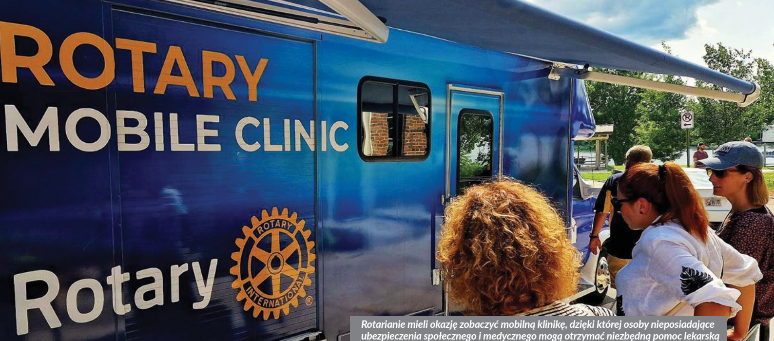
Rotarianie mieli okazję zobaczyć mobilną klinikę, dzięki której osoby nieposiadające ubezpieczenia społecznego i medycznego mogą otrzymać niezbędną pomoc lekarską

możliwość zaprezentowania aktywności rotariańskich, realizowanych w reprezentowanych przez nas klubach.