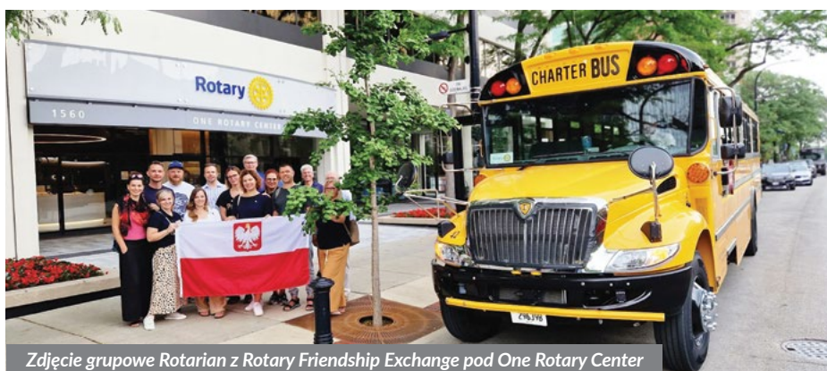
Zdjęcie grupowe Rotarian z Rotary Friendship Exchange pod One Rotary Center