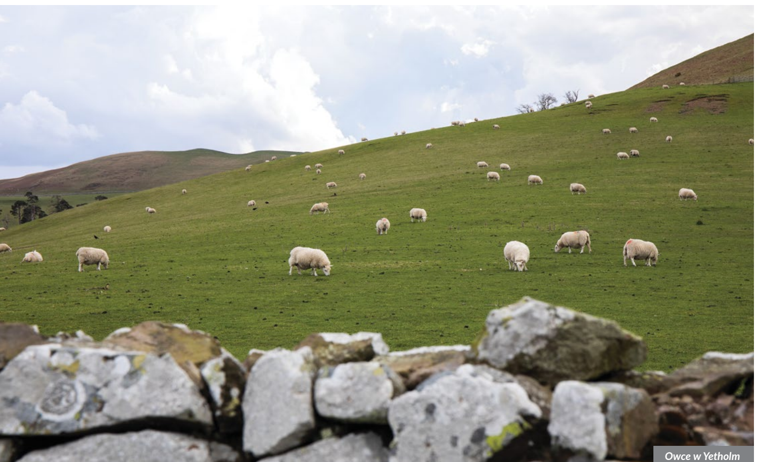
Owce w Yetholm