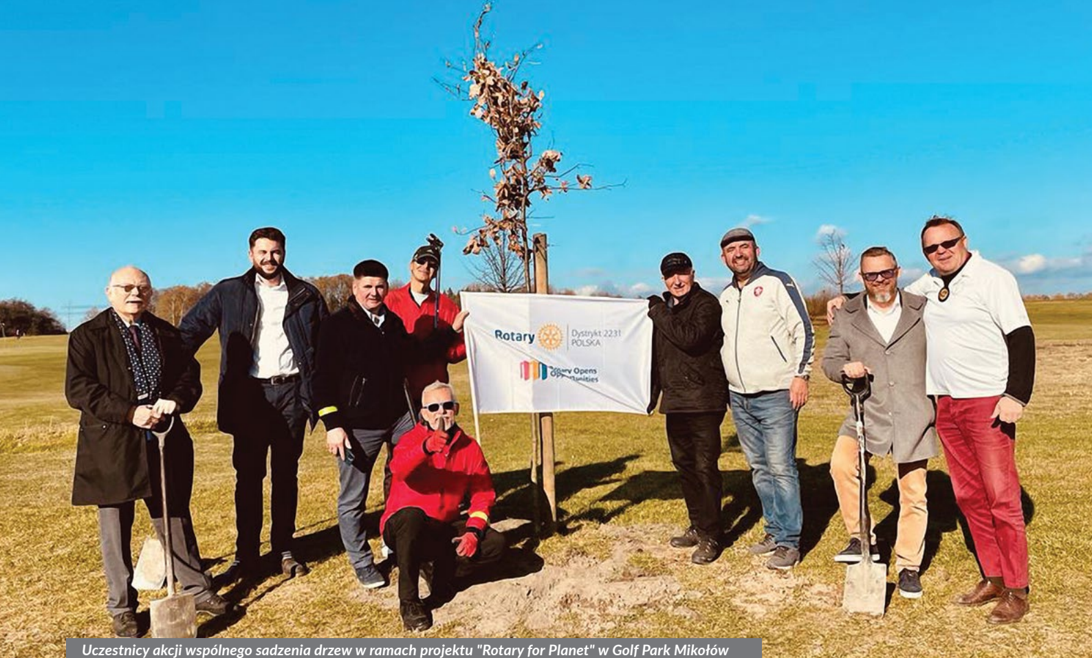
Uczestnicy akcji wspólnego sadzenia drzew w ramach projektu "Rotary for Planet" w Golf Park Mikołów