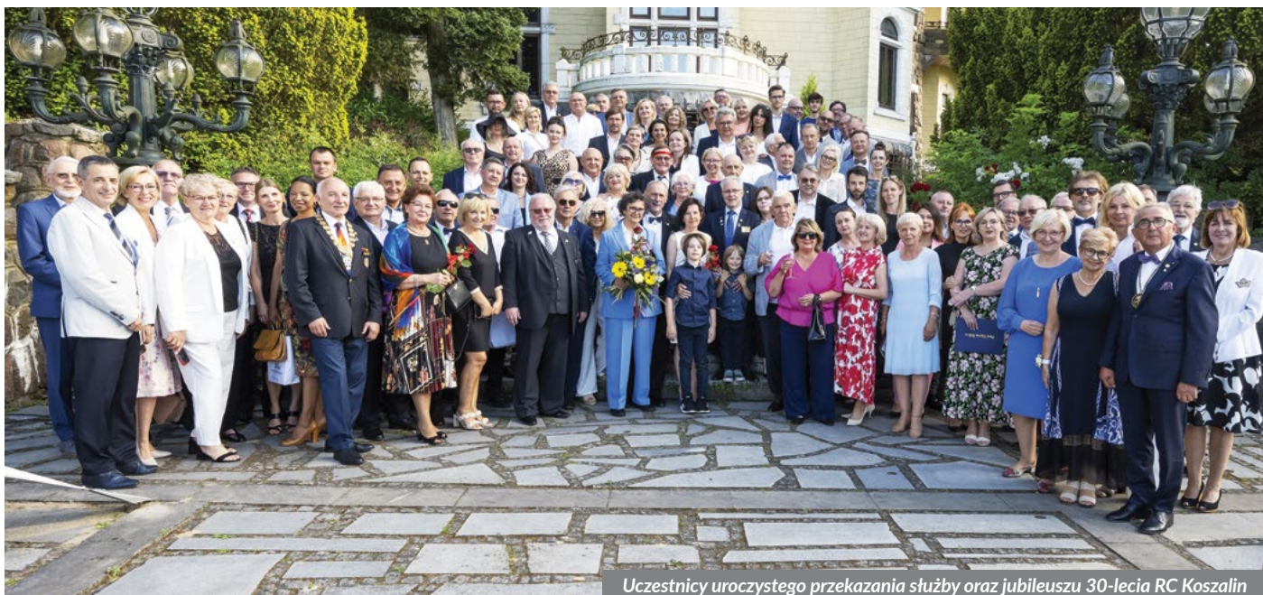
Uczestnicy uroczystego przekazania służby oraz jubileuszu 30-lecia RC Koszalin