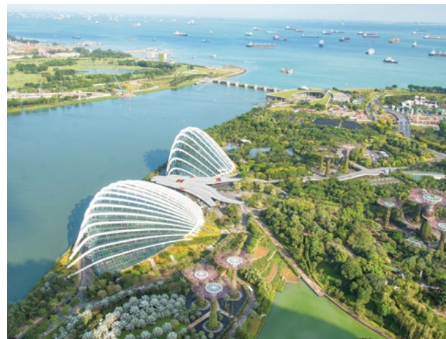
Natura i technologia harmonijnie łączą się, tworząc zapierające dech w piersiach widoki

Natura i technologia harmonijnie łączą się, tworząc zapierające dech w piersiach widoki, takie jak kilka gigantycznych wodospadów stworzonych przez człowieka... w tym jeden na głównym lotnisku! Ogrody nad zatoką obok głównej Sali Konwencji łączą w sobie przyrodę i artystyczną fantazję, w tym stalowe „supertrees” i sztuczną krytą górę.