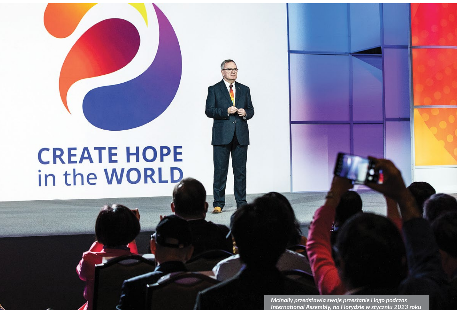
McNally przedstawia swoje przesłanie i logo podczas International Assembly, na Florydzie w styczniu 2023 roku

„Moi rodzice zaszczepili we mnie i moim śp. bracie chęć pomagania i uczucie troski o innych, które pozostało ze mną na całe życie”