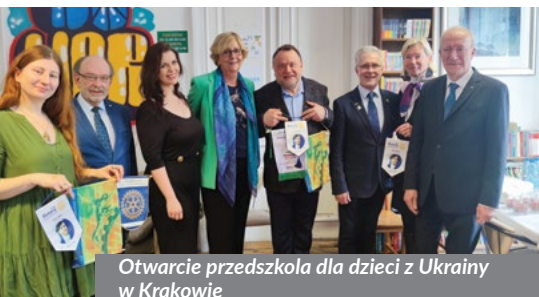
Otwarcie przedszkola dla dzieci z Ukrainy w Krakowie