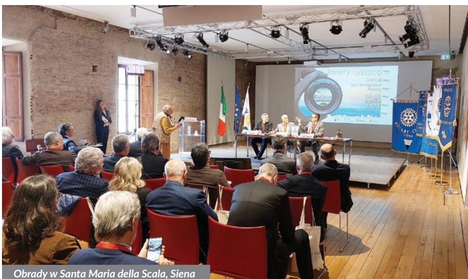
Obrady w Santa Maria della Scala, Siena