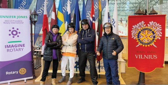
Zimowa Rotariada w Druskiennikach na Litwie. Mieszana drużyna polskich klubów Rotary (RC Warszawa Józefów, RC Białystok i RC Koszalin)