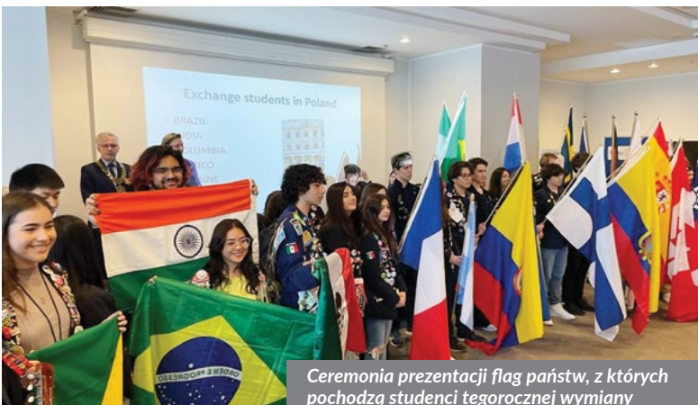
Ceremonia prezentacji flag państw, z których pochodzą studenci tegorocznej wymiany