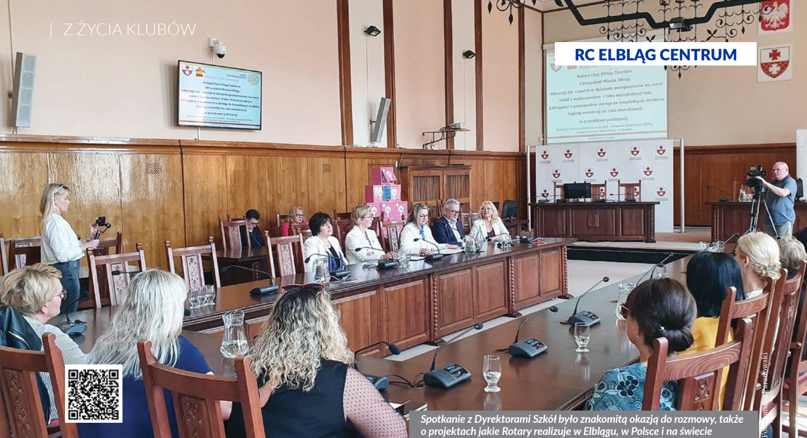
Spotkanie z Dyrektorami Szkół było znakomitą okazją do rozmowy, także o projektach jakie Rotary realizuje w Elblągu, w Polsce i na świecie