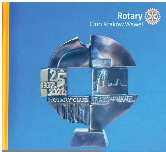
Okładka jubileuszowej publikacji