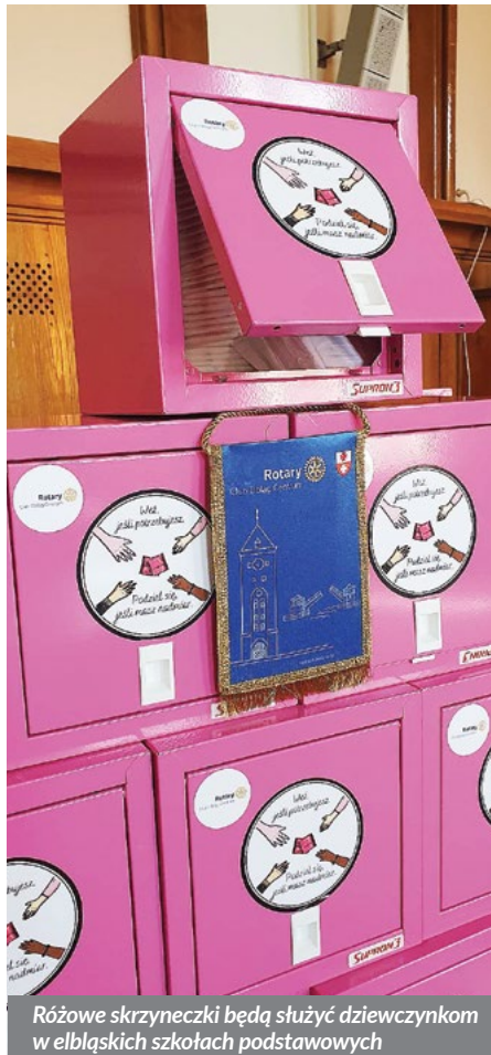
Różowe skrzyneczki będą służyć dziewczynkom w elbląskich szkołach podstawowych

– Zakupione przez Rotary skrzyneczki, wraz z podpaskami i tamponami dostarczonymi przez Urząd Miasta w ramach programu Bezpieczny Elbląg, przyczynią się do większej dostępności środków hi-