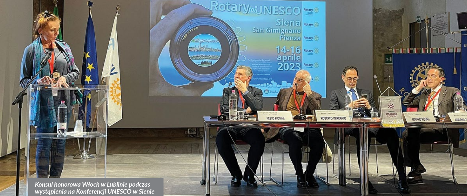
Konsul honorowa Włoch w Lublinie podczas wystąpienia na Konferencji UNESCO w Sienie