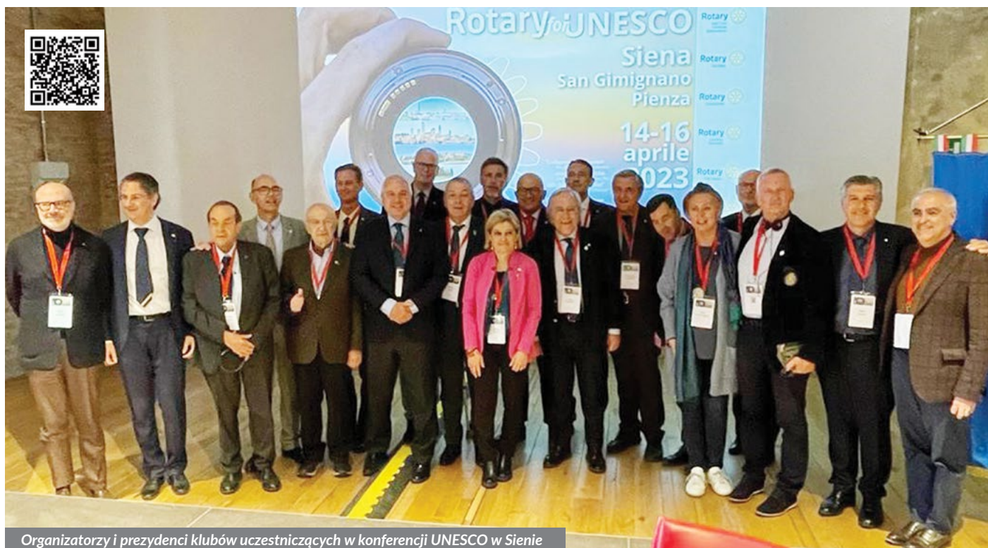
Organizatorzy i prezydenci klubów uczestniczących w konferencji UNESCO w Sienie