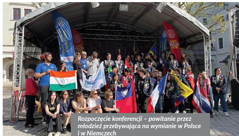
Rozpoczęcie konferencji - powitanie przez młodzież przebywająca na wymianie w Polsce i w Niemczech