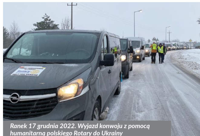
Ranek 17 grudnia 2022. Wyjazd konwoju z pomocą humanitarną polskiego Rotary do Ukrainy