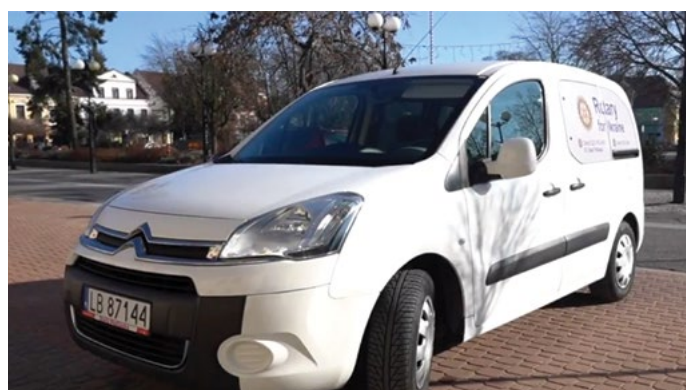
Zakupiony przez Rotarian samochód został przekazany do Miejskiego Ośrodka Pomocy Społecznej w Białej Podlaskiej

- Ten zakup nie byłby możliwy, gdyby nie pomoc naszych przyjaciół Rotarian z USA z Portland, którzy zorganizowali zbiórki i w tym jest właśnie siła Rotary że wspieramy się nawzajem