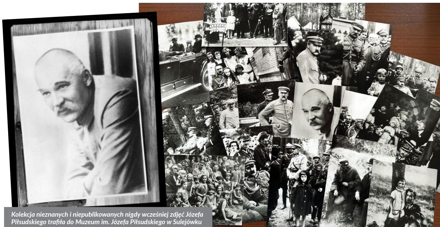
Kolekcja nieznanymi i niepublikowanymi nigdy wcześniej zdjęć Józefa Piłsudskiego trafiła do Muzeum im. Józefa Piłsudskiego w Sulejówku