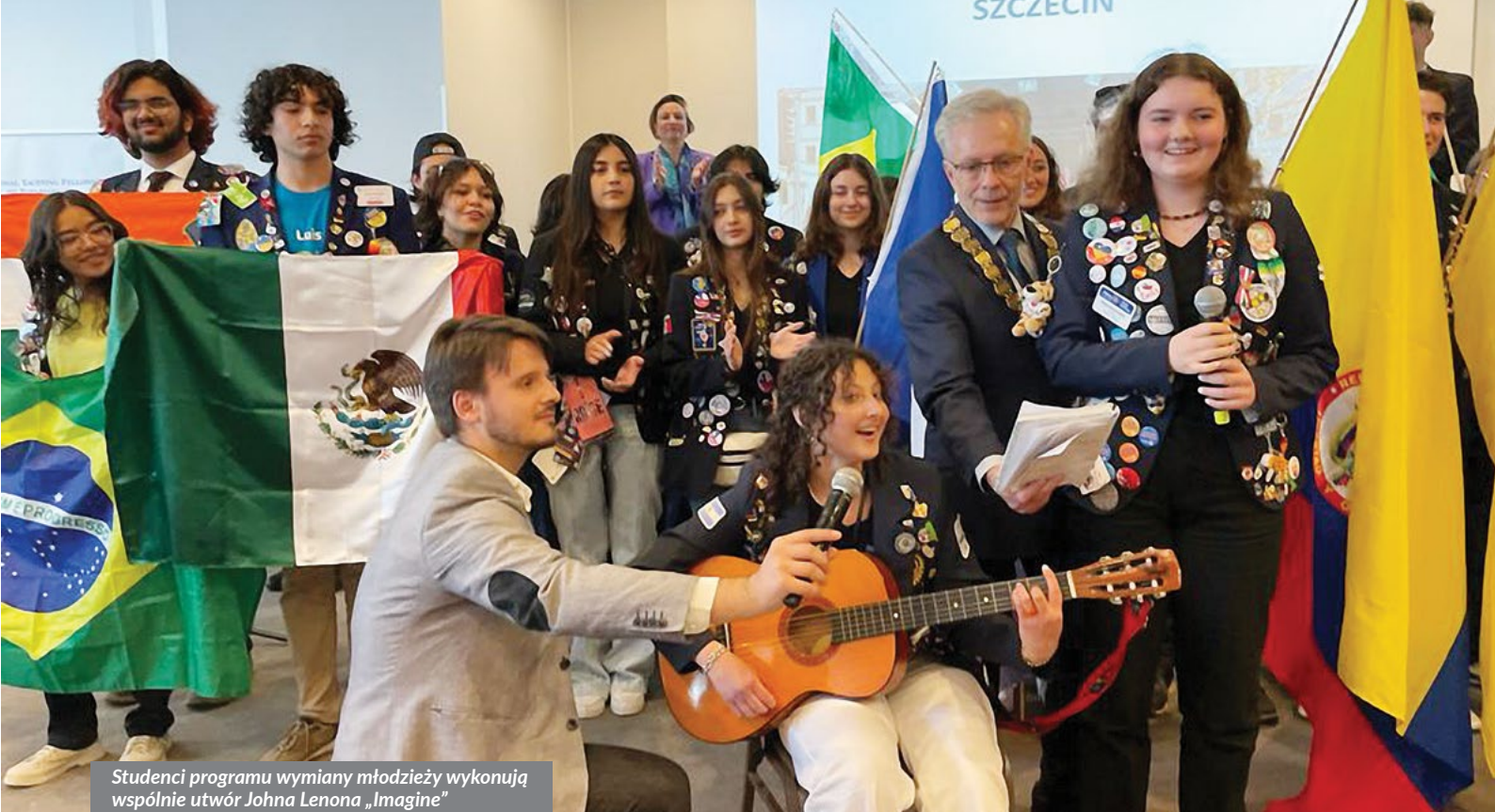
Studenci programu wymiany młodzieży wykonują wspólnie utwór Johna Lenona „Imagine”