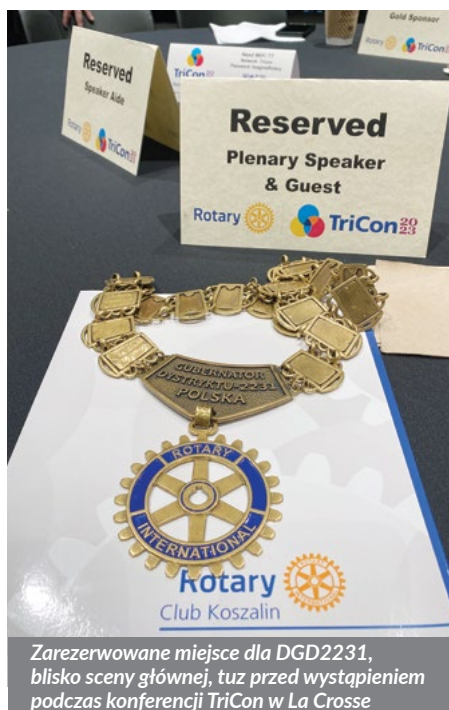
Zarezerwowane miejsce dla DGD2231, blisko sceny głównej, tuż przed wystąpieniem podczas konferencji TriCon w La Crosse