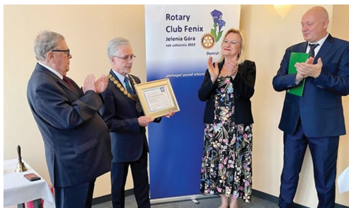
28 września 2022 roku odbyła się uroczystość charteru nowego klubu - RC Fenix Jelenia Góra