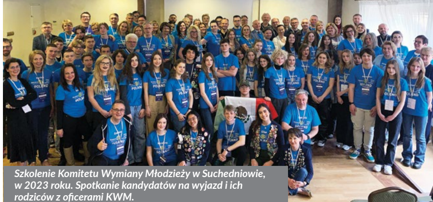
Szkolenie Komitetu Wymiany Młodzieży w Suchedniowie, w 2023 roku. Spotkanie kandydatów na wyjazd i ich rodziców z oficerami KWM.