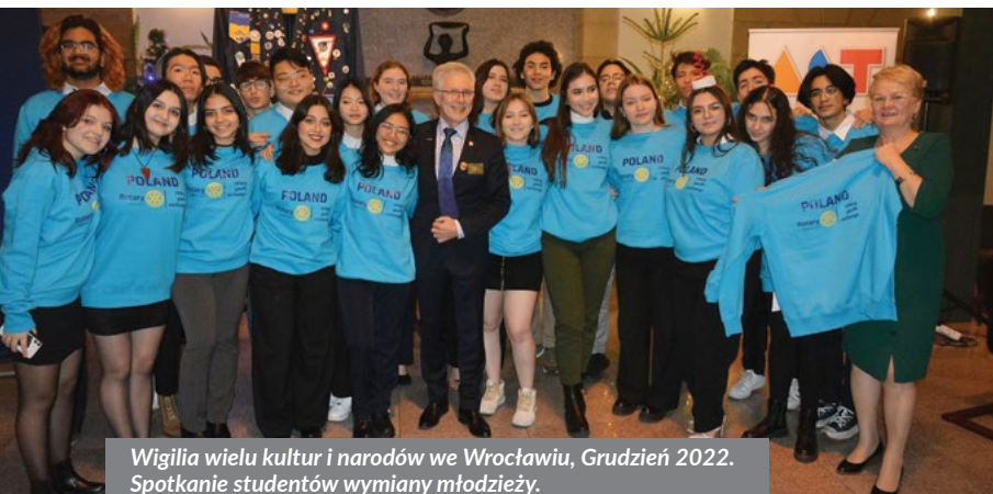
Wigilia wielu kultur i narodów we Wrocławiu, Grudzień 2022. Spotkanie studentów wymiany młodzieży.