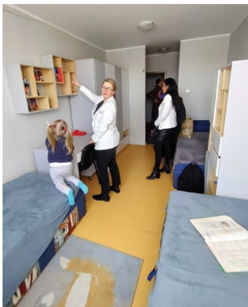
Dzieci z radością pokazywały swoje nowe mebelki