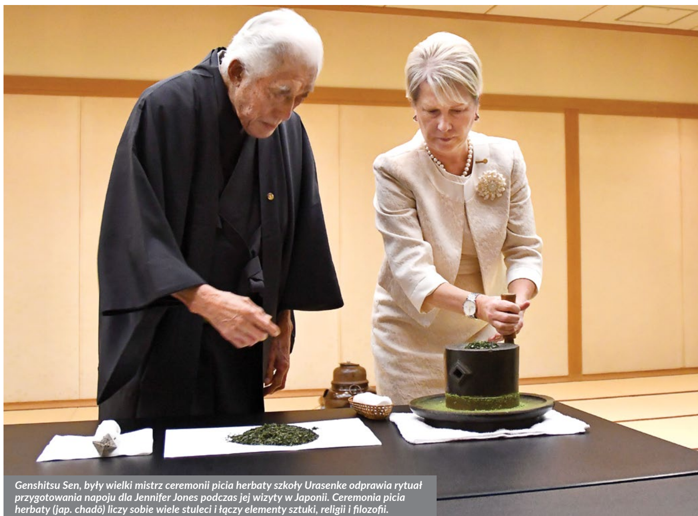
Genshitsu Sen, były wielki mistrz ceremonii picia herbaty szkoły Urasenke odprawia rytuał przygotowania napoju dla Jennifer Jones podczas jej wizyty w Japonii. Ceremonia picia herbaty (jap. chadō) liczy sobie wiele stuleci i łączy elementy sztuki, religii i filozofii.