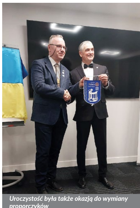
Uroczystość była także okazją do wymiany proporczyków