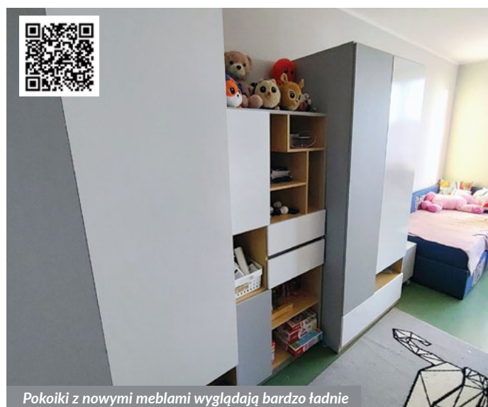
Pokoiki z nowymi meblami wyglądają bardzo ładnie

Gdy tego słuchałyśmy płynęły nam łezki szczęścia, że udało się pomóc tym kochanym dzieciom. Nadal chcemy im pomagać.