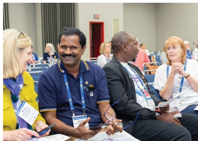
Breakout Session poświęcona budowaniu pokoju w 2022 roku podczas Międzynarodowej Konwencji Rotary w Houston

Wiele wystąpień poruszy temat nowych form służby, np. centrów technologicznych, które mogą pomóc wyjść młodym ludziom z biedy, przełamania tabu dot. potrzeb menstruacyjnych, rozważenia przejścia na diety bogate w produkty roślinne dla dobra klimatu, walki z niewolnictwem, zanieczyszczenia plastikami, niedożywienia i wielu innych. Zapoznajcie się z pełną listą sesji na stronie Konwencji i wybierzcie te, które najbardziej was interesują. Breakout Sessions odbędą się w dniach 29-31 maja. Rejestracja nie jest wymagana, a miejsca siedzące będą dostępne w systemie „kto pierwszy, ten lepszy”. Rose Shilling