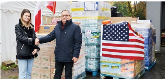
RC Puławy przekazał dla uchodźców artykuły spożywcze i higieniczne o wartości ponad 50 tys. zł