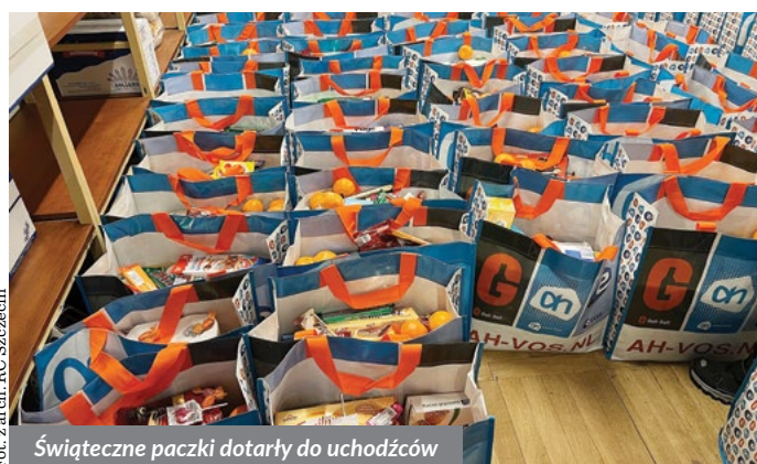
Świąteczne paczki dotarły do uchodźców