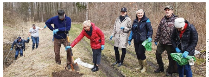
Podczas akcji posadzono 100 sadzonek drzewek