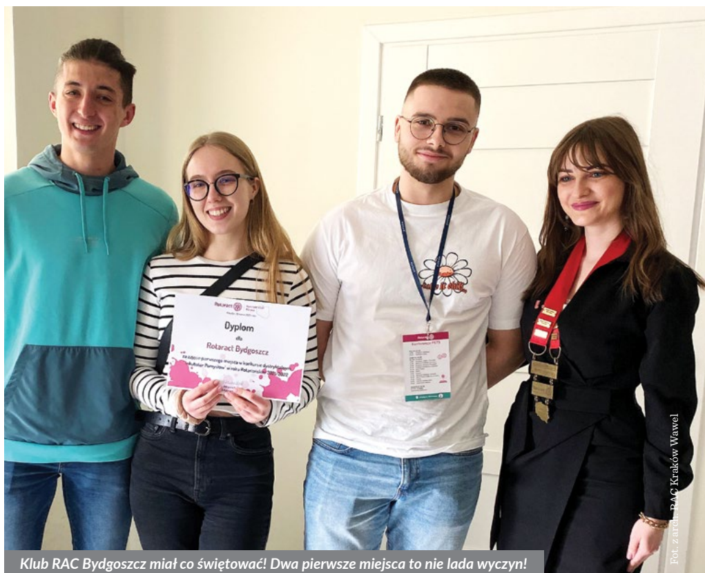
Klub RAC Bydgoszcz miał co świętować! Dwa pierwsze miejsca to nie lada wyczyn!