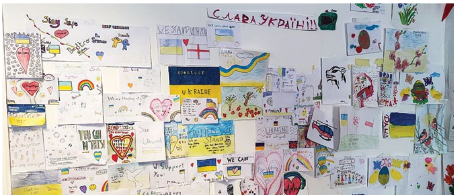
Rysunki dzieci mieszkających w hostelu interwencyjnym prowadzonym przez Fundację „WOLNO NAM”.