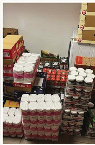
Żywność zakupiona dla hostelu

Dwie działające dla uchodźców fundacje w Krakowie „Zupa dla Ukrainy” oraz „Dobro Zawsze Wraca” zostały wsparte przez