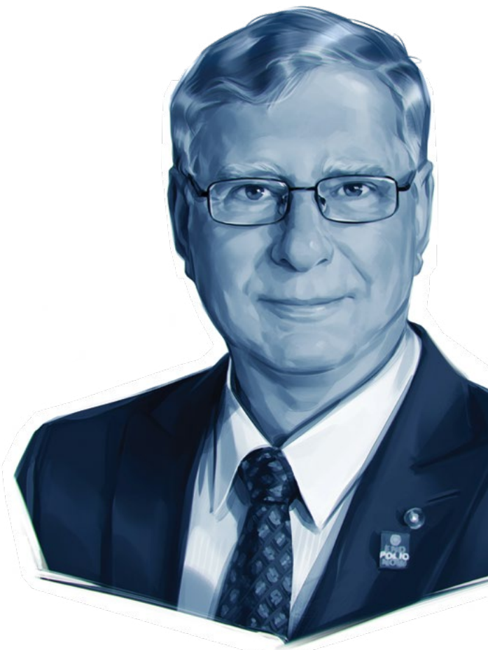
Ilustracja: Viktor Miller Gausa

Ian H. S. Riseley Przewodniczący Fundacji Rotary