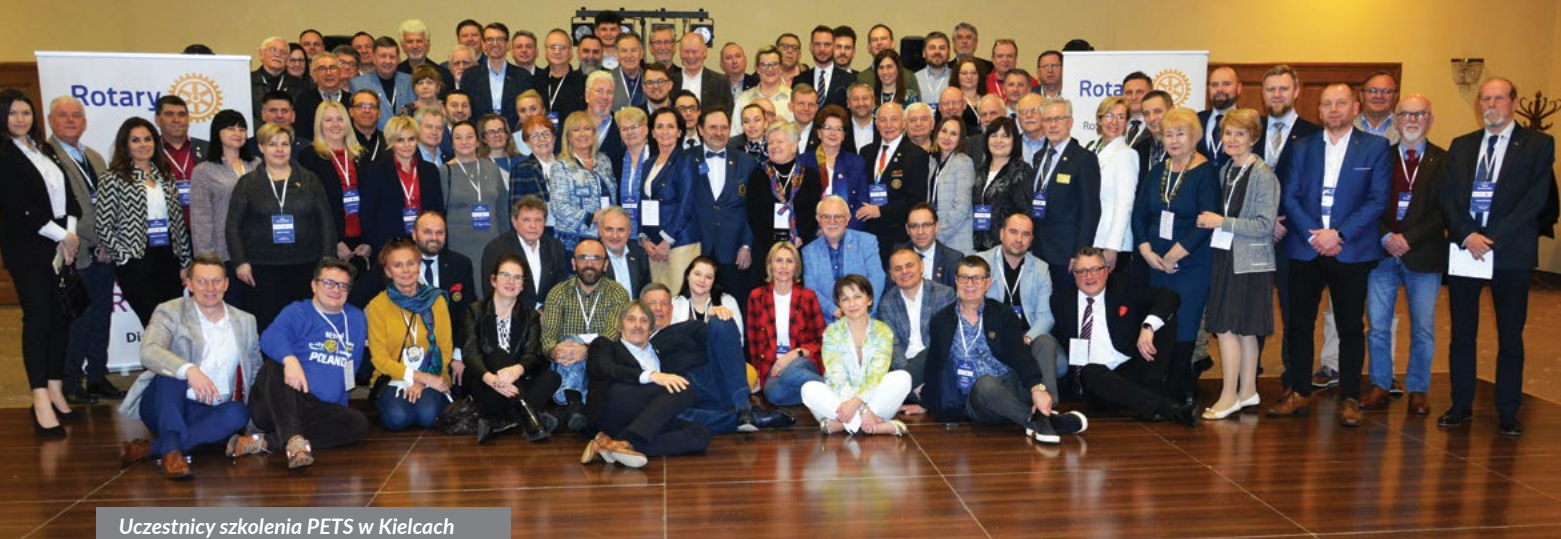
Uczestnicy szkolenia PETS w Kielcach