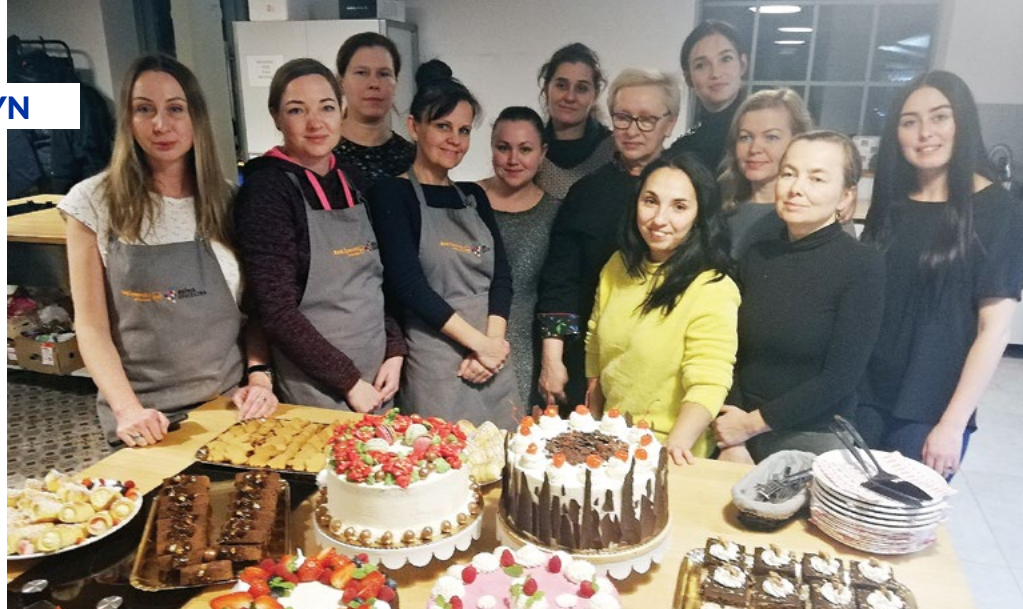
Od 25 listopada 2022 roku 17 uchodźczyń z Ukrainy brało udział w specjalistycznym Kursie Cukierniczym. Projekt był odpowiedzią na potrzeby osób uciekających z terenu Ukrainy do Polski