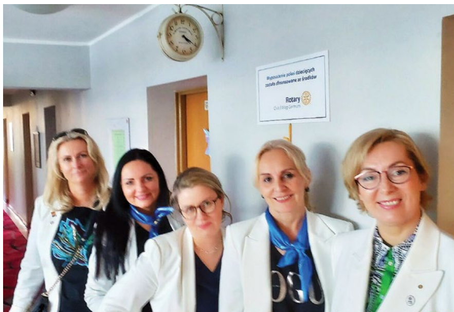
Nic tak nie cieszy jak radość dzieci. To ogromna satysfakcja