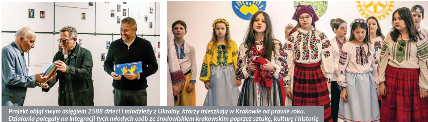
Projekt objął swym zasięgiem 2588 dzieci i młodzieży z Ukrainy, którzy mieszkają w Krakowie od prawie roku. Działania polegały na integracji tych młodych osób ze środowiskiem krakowskim poprzez sztukę, kulturę i historię