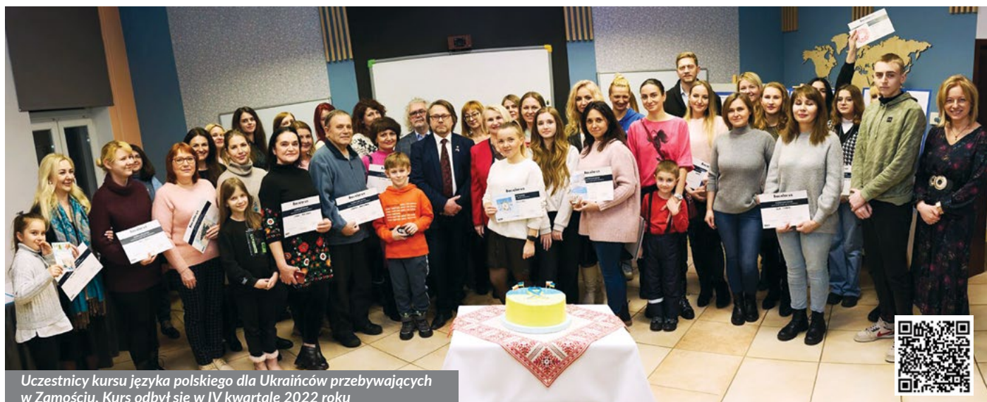
Uczestnicy kursu języka polskiego dla Ukraińców przebywających w Zamościu. Kurs odbył się w IV kwartale 2022 roku