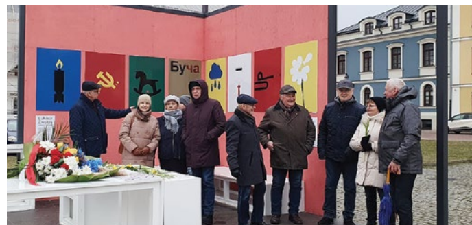
W rocznicę napaści Rosji na Ukrainę, 24. lutego 2023 roku, członkowie RC Zamość spotkali się na Rynku Solnym w Zamościu

Kompozycja, która stała się miejscem naszego meetingu odwzorowuje geometrię przestrzenną pokoju pierwszego dyrektora Bauhausu w Weimarze. Historyczny Bauhaus jest dzisiaj najbardziej wpływową instytucją edukacyjną w dziedzinie architektury, sztuki i designu XX wieku. Łukasz Zwolna, absolwent