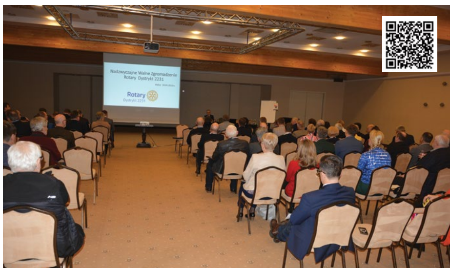
Pobyt Rotarian w Kielcach został przygotowany z dużą dbałością o zapewnienie idealnych warunków do przeprowadzenia PETS i wydarzeń towarzyszących