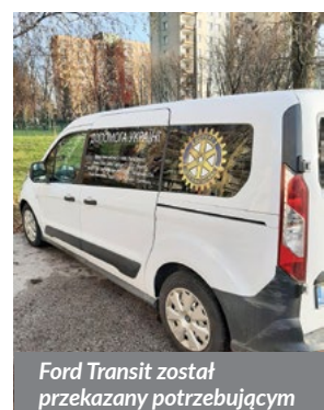
Ford Transit został przekazany potrzebującym