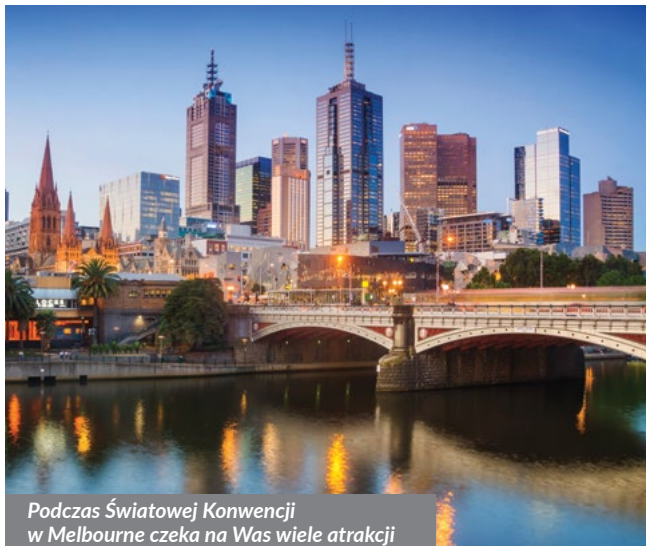
Podczas Światowej Konwencji w Melbourne czeka na Was wiele atrakcji