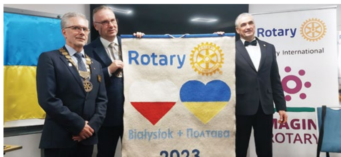
Przyjaciele z Ukrainy przekazali nam piękną, ręcznie zrobioną chorągiew z polskim i ukraińskim sercem, chorągiew będzie nam towarzyszyła w naszych spotkaniach i służbie!

gości. W 2022 roku, dzięki współpracy z zaprzyjaźnionymi Klubami z Polski, USA i Litwy zakupiliśmy nowoczesne specjalistyczne narzędzia chirurgiczne, z najwyższej światowej półki, umożliwiające prowadzenie skomplikowanych i wielogodzinnych operacji skolioz u dzieci z naszego podlaskiego regionu, sprzęt już kilka dni po przekazaniu do kliniki rozpoczął swoją pracę! Od kilku lat prowadzimy projekt edukacji dzieci z domów dziecka w Białymstoku, w tym roku obiliśmy tym programem rekordową ilość podopiecznych. W planach chcemy także zorganizować kolejne Charytatywne Turnieje Piłkarskie, rozbudować naszą VR Art. Gallery w świecie rozszerzonej rzeczywistości poprzez organizację wystaw także związanych ze sztuką kobiet oraz