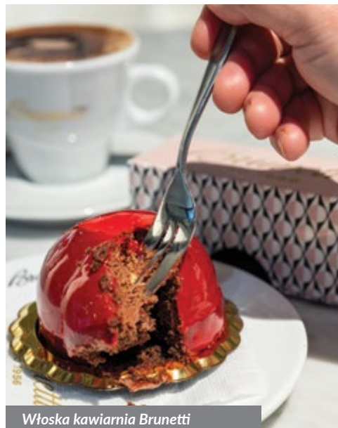
Włoska kawiarnia Brunetti