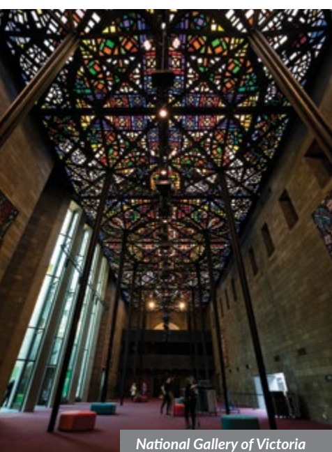
National Gallery of Victoria