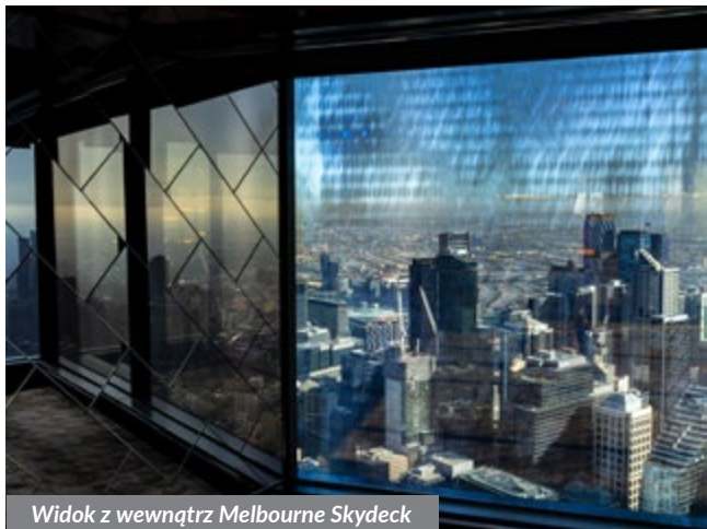
Widok z wewnątrz Melbourne Skydeck