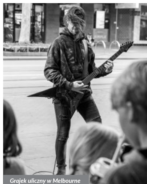
Grajek uliczny w Melbourne