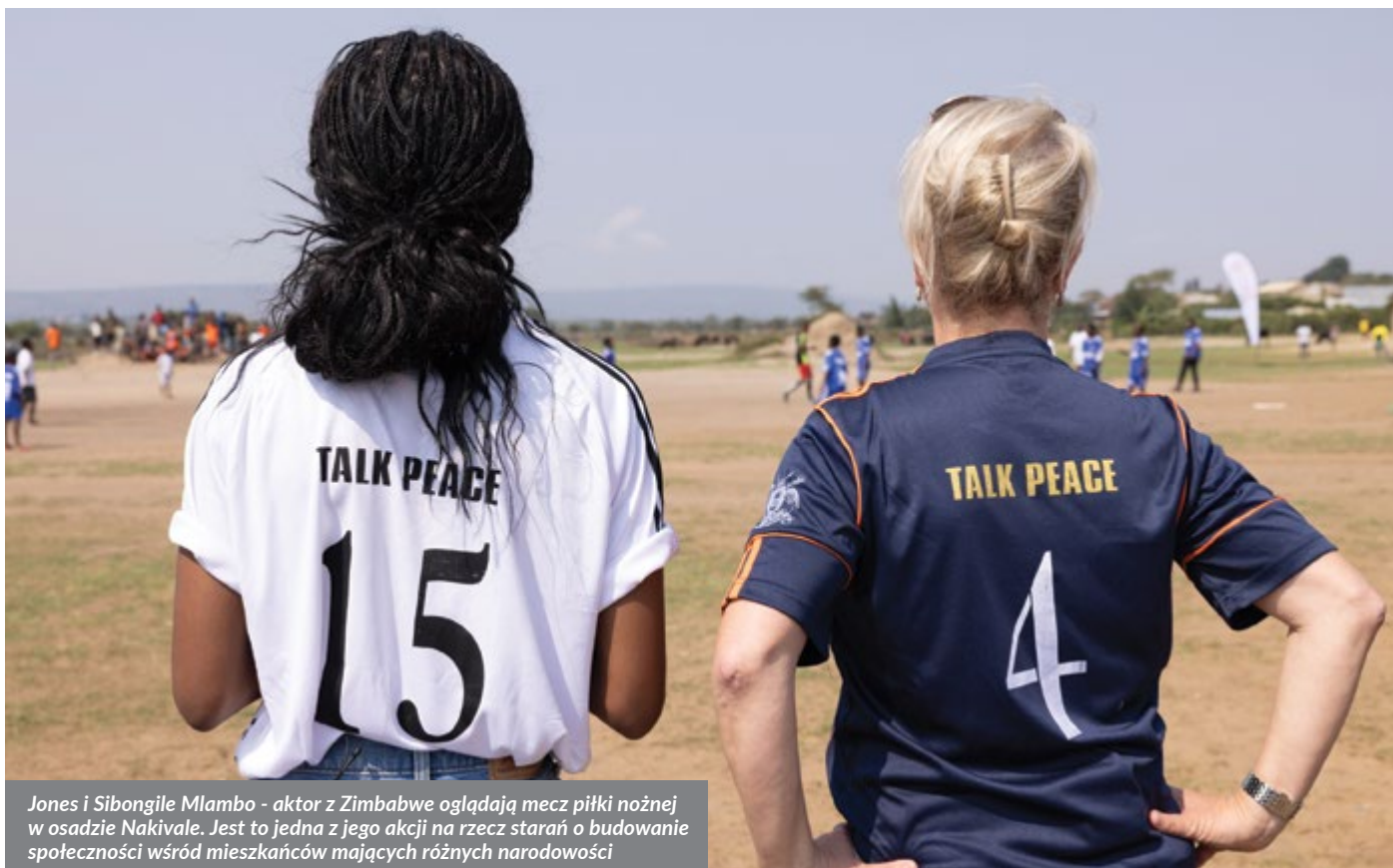
Jones i Sibongile Mlambo - aktor z Zimbabwe oglądają mecz piłki nożnej w osadzie Nakivale. Jest to jedna z jego akcji na rzecz starań o budowanie społeczności wśród mieszkańców mających różnych narodowości