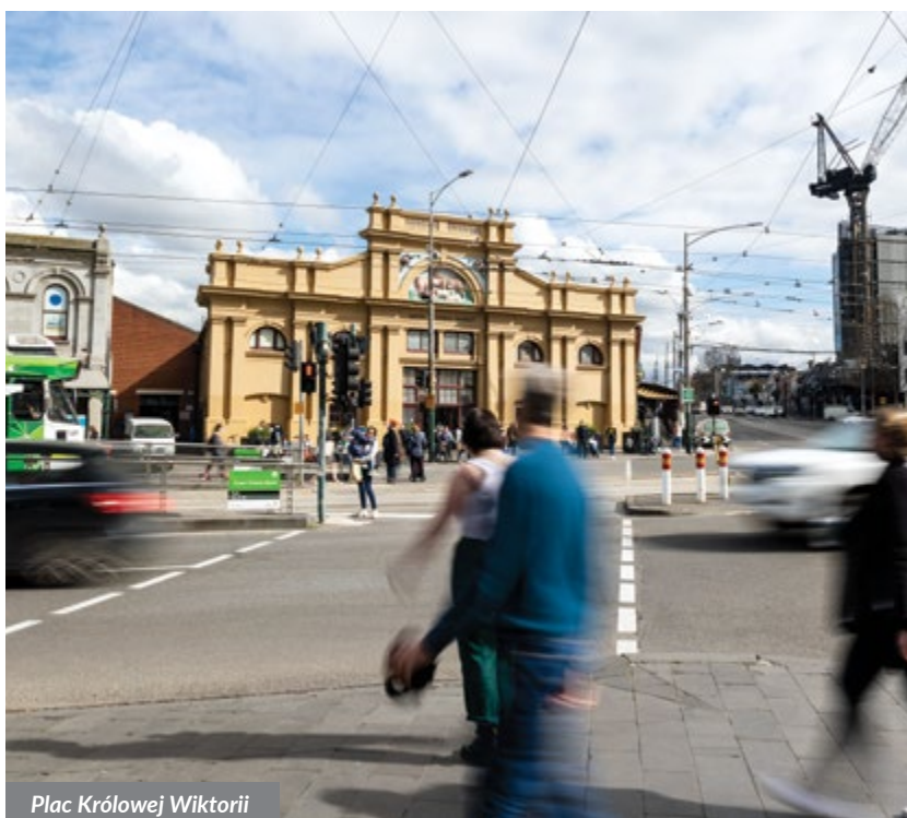
Plac Królowej Wiktorii