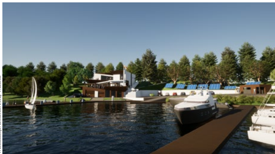
Wizualizacja: architekt Jerzy Walasek