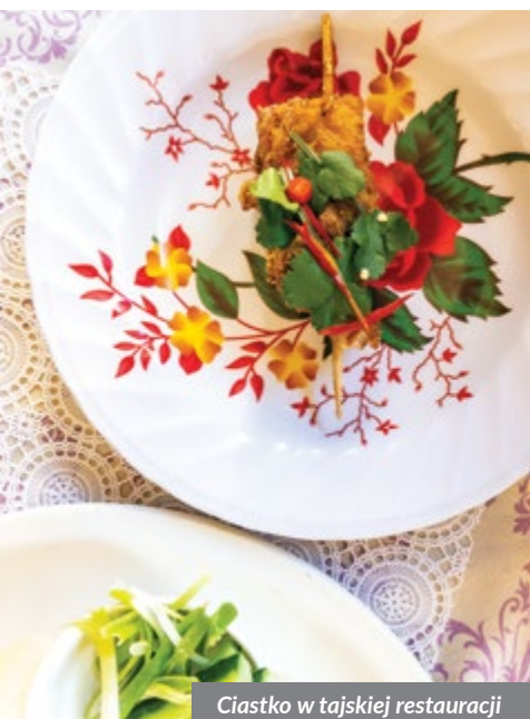
Ciastko w tajskiej restauracji