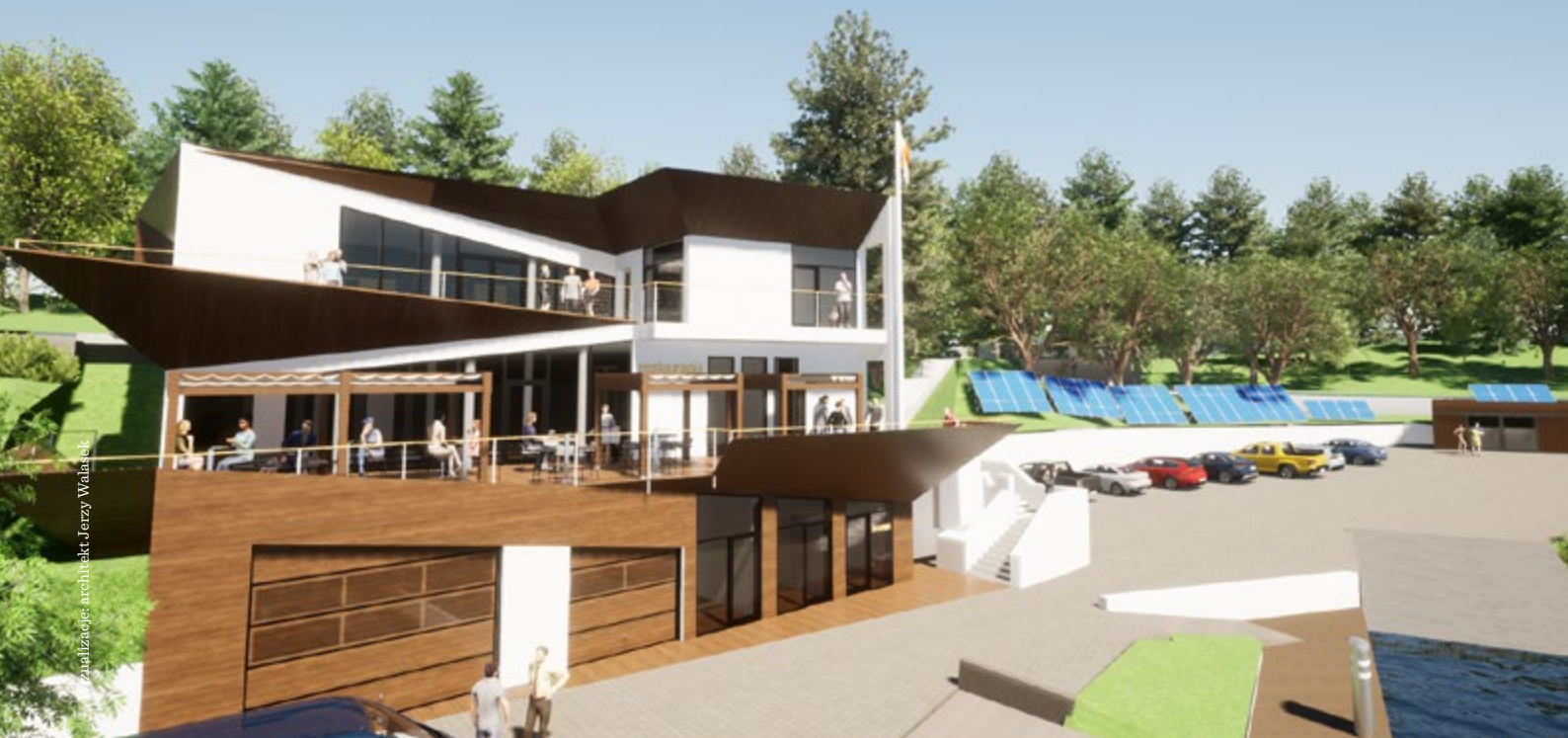
Wizualizacja: architekt Jerzy Walasek

cięliśmy 22 drzewa zagrażające bezpieczeństwu żeglugi na kanale oraz usunęliśmy śmieci z dna, w tym przedwojenną konstrukcję mostu i siedemnaście min przeciwpiechotnych z okresu II wojny światowej. Łączny koszt tych działań wyniósł 23 700 zł.