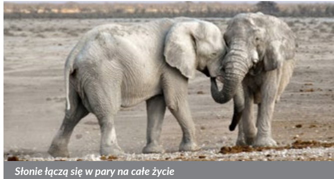
Słonie łączą się w pary na całe życie

Słonie łączą się w pary na całe życie. Kiedy umiera członek stada składają kości w miejscach, które my nazywamy cmentarzami. Badacze przyrody stwierdzili, że „pogrzebom” tym towarzyszy rozpacz i coś co przypomina nasz płacz. Podglądanie orłów w locie przebudowało przemysł lotniczy i na końcach skrzydeł samolotów pojawiły się małe, pionowe stateczniki. Kiedy zrozumiemy do końca jak zbudowana jest skóra delfinów statki przyszłości będą pływać dwa razy szyb-