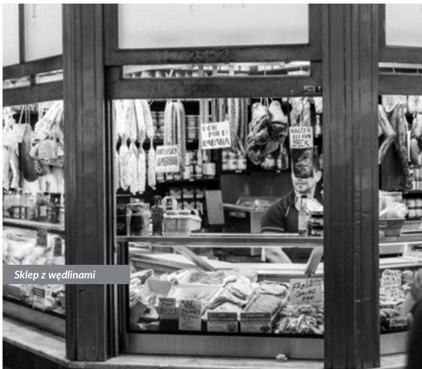
Sklep z wędlinami