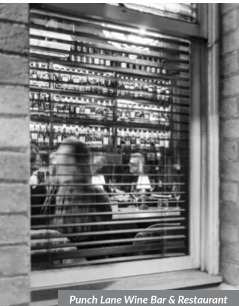
Punch Lane Wine Bar & Restaurant