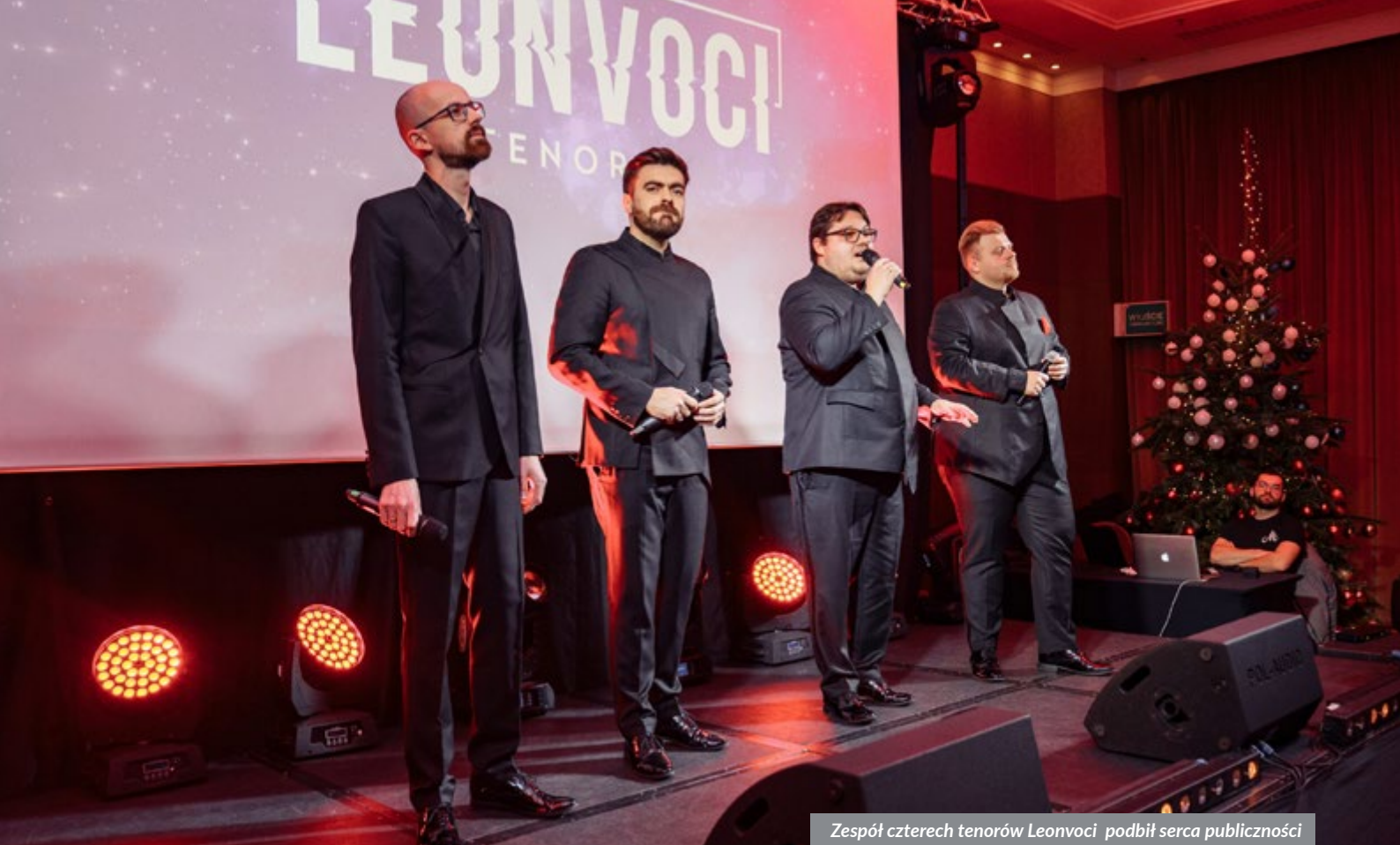
Zespół czterech tenorów Leonvoci podbił serca publiczności