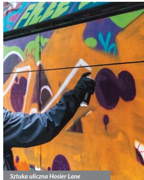
Sztuka uliczna Hosier Lane