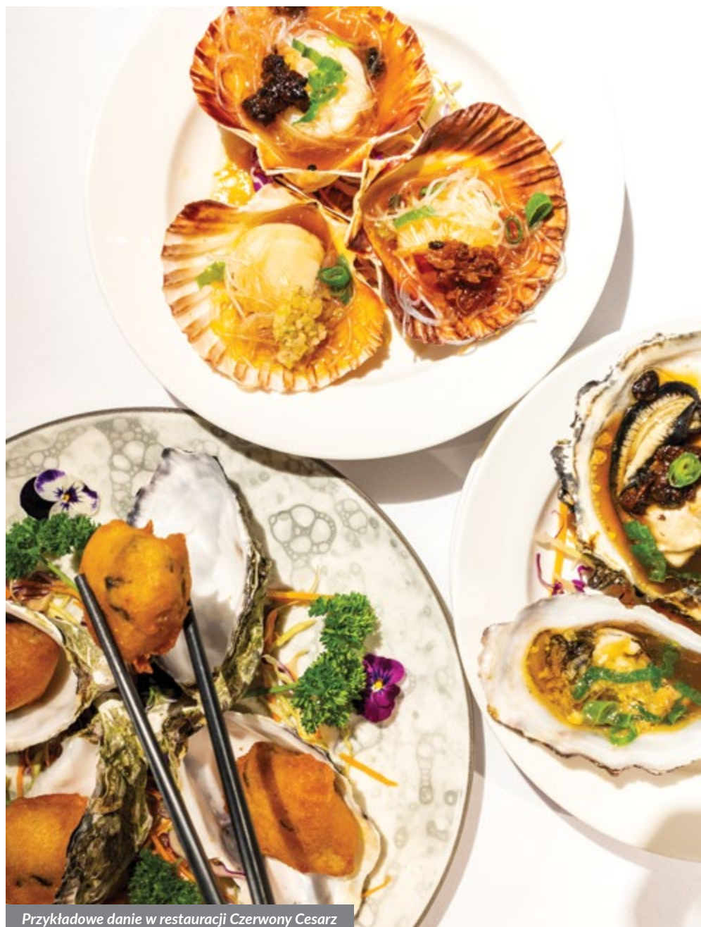
Przykładowe danie w restauracji Czerwony Cesarz