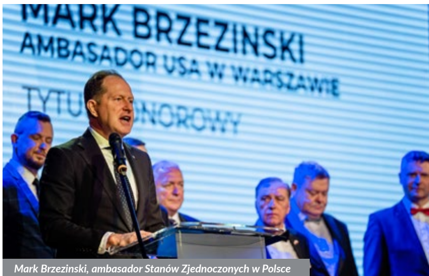
Mark Brzezinski, ambasador Stanów Zjednoczonych w Polsce