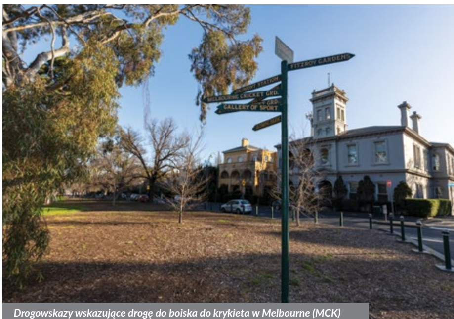
Drogowskazy wskazujące drogę do boiska do krykieta w Melbourne (MCK)

Jeśli jednak wolicie jednoślady, to koniecznie udajcie się na Phillip Island z motocyklowym torem wyciągowym Australian Motorcycle Grand Prix... albo coś zupełnie z innej beczki – paradę pingwinów o zachodzie słońca, w której „biorą udział” tysiące ptaków.