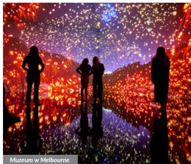
Muzeum w Melbourne

Aby dowiedzieć się więcej, wejdź na rotarymelbourne2023.org/tours