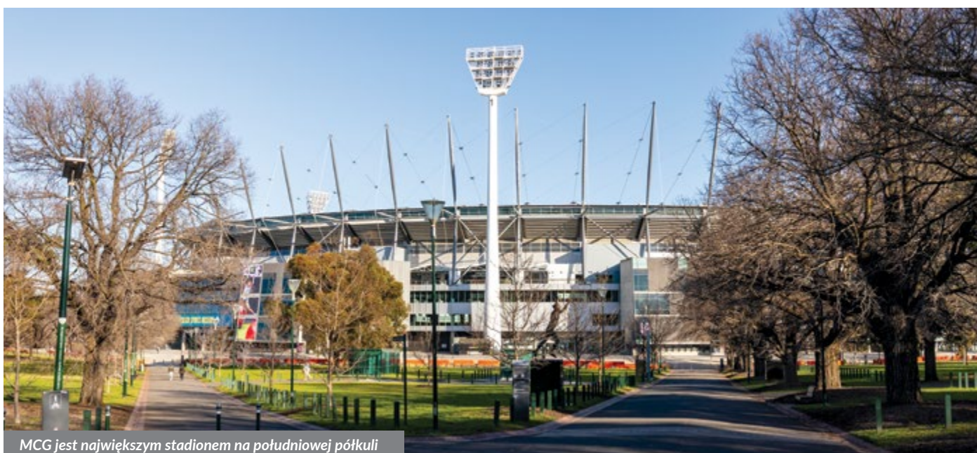
MCG jest największym stadionem na południowej półkuli